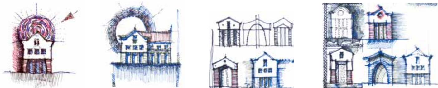
▲ Lakó- és irodaház, Mátyás király utca, Szombathely, 2012