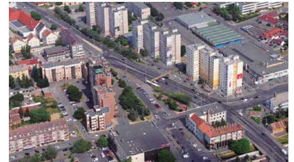
▲ Szent Márton utca és környezete, légi felvétel