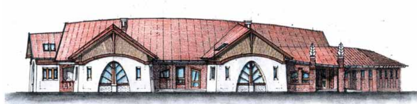
▲ Waldorf óvoda, Szombathely, 2007