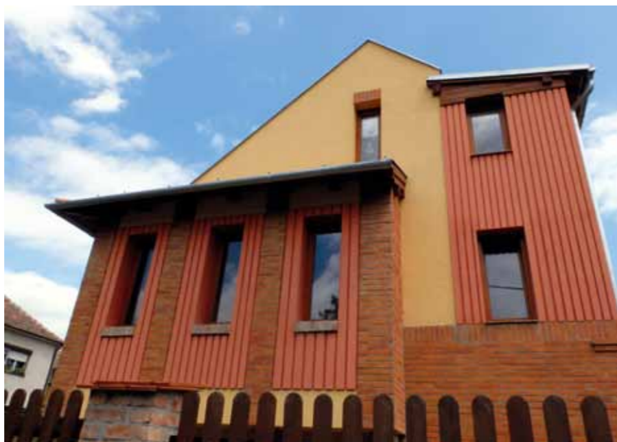
▲ Társasház, Szombathely, Wälder Alajos utca, 2010

Szombathelyi tevékenységem „legszebb gyümölcse” kétségtelenül a már említett Waldorf-óvoda. Külön öröm volt számomra, hogy már