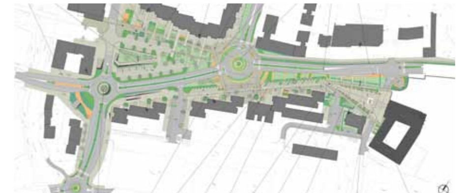
▲ Szent Márton utca és környezetének fejlesztése, Szombathely, közterület alakítási terv, 2014

egyre több embert ismertünk meg, elkezdtünk beleszövödni az itteni létbe. Öt éve éltünk Szombathelyen, amikor már a városfejlesztési bizottság külső szakértője voltam. Nem hiszem, hogy más városban ez megtörténhetett volna. Persze itt is adódhatnak nehézségek: Szombathely nagyon közel van a határhoz, már a hetvenes évektől ki lehetett járni Ausztriába. Egyrészt a mai napig van egy nagyon erős szívóhatás, másrészt pedig kialakult egy olyan kiskereskedő réteg, amely ezt a közelséget erőteljesen kihasználta, és igen hamar meggazdagodott belőle. Az anyagi gyarapodás azonban nem mindenkinél járt együtt műveltségbeli fejlődéssel, így védtelenek maradtak a nyugatról jövő, középszerű, vagy még rosszabb mintákkal szemben. Bár könnyebb volt munkát találni és építeni, mégis, a mai napig nehéz