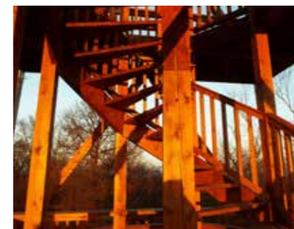
▼▲ Kilátó a Dudáska-hegyen, Szügy. Statikus: Demeter László, 2015