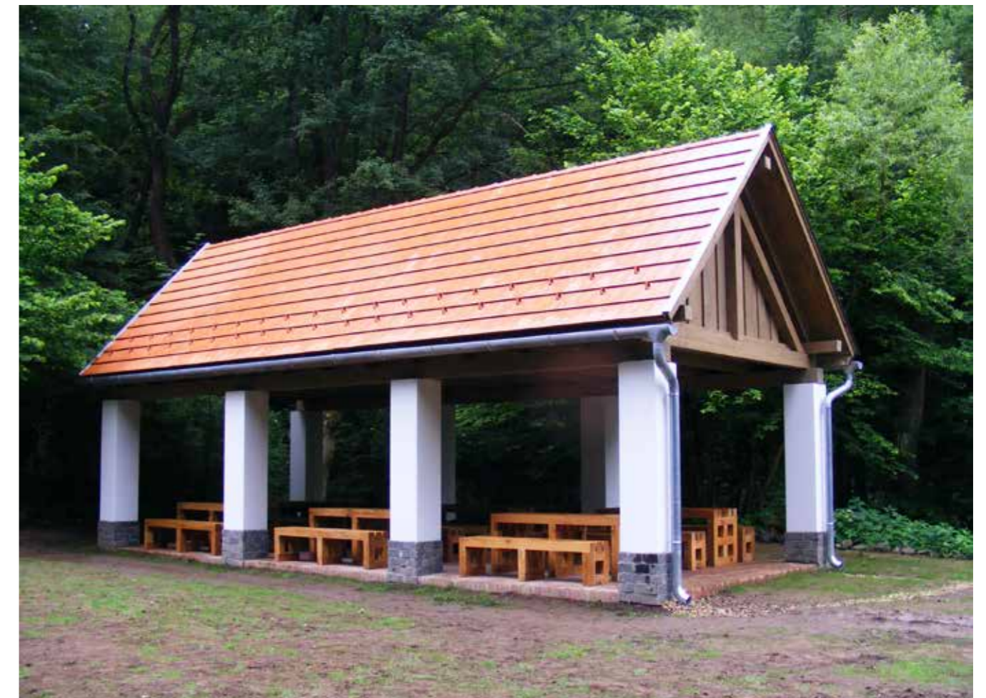
▲ Fűvészkert és Vadaspark fogadóépülete, Balassagyarmat-Nyírjes, 2015