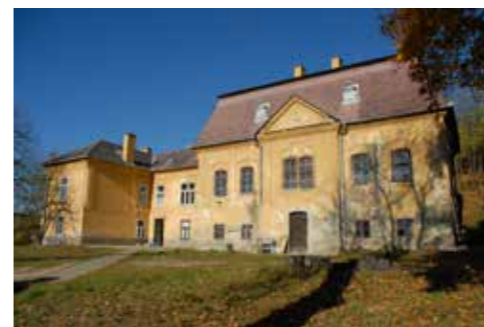
▲ Eredeti állapot