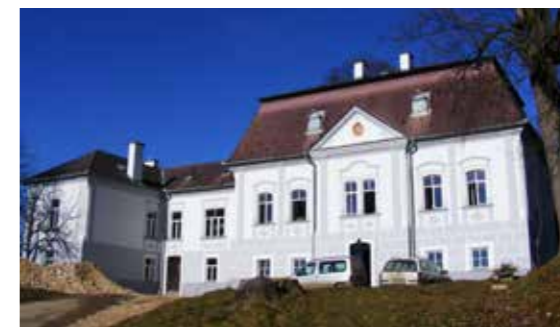
▲ Hilltop Neszmély Borhotel és Étterem, Neszmély, 1997