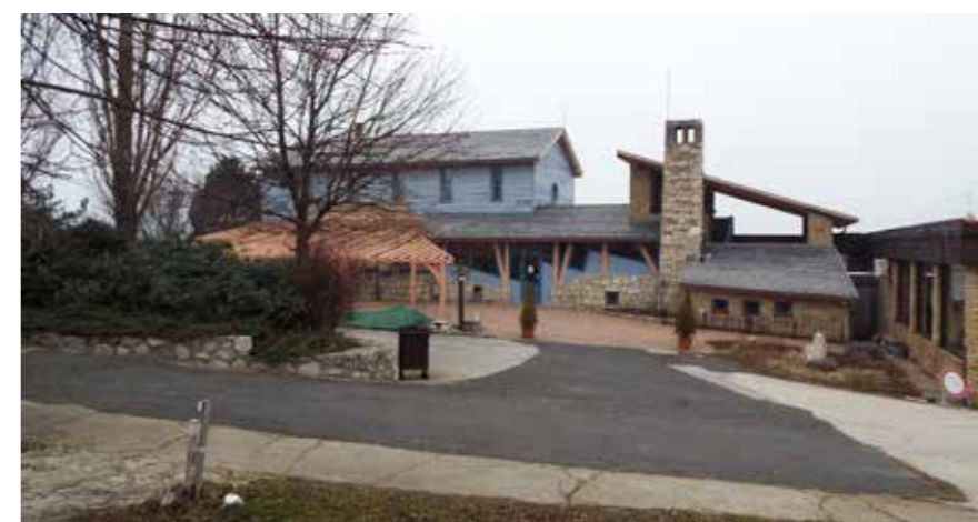
▲ Hilltop Neszmély Borhotel és Étterem, Neszmély, 1997