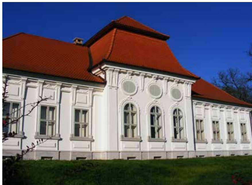
▼ Huszár-Purgly-kastély, Keszeg. Munkatárs: Bögös András, 2011

tudott velem jönni vándorolni. Így hát jelentkeztem, megcsináltam a portfóliót, elmentem még előtte tíz napra az Őrségbe gyalogtúrára. Vasárnap este értem haza, hétfőn kellett bevinni a terveket. Úgyhogy vasárnap este megrajzoltam a felvételi feladatot, az is egy turistaház vagy hasonló volt. Egy hét múlva zajlott le a felvételi beszélgetés, és felvettek.